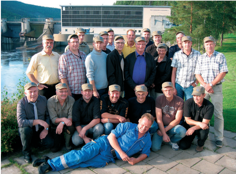
Järkvissle Kraftverks 50-årsfest 2009.