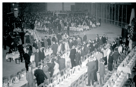
I maskinhallen i Järkvissle hölls en av flera 50-årsfester i landet till Statens Vattenfallsverks ära.

Färdigställandet av Järkvissle Kraftverk firades med en slutfest i traditionsenlig stil med andra vattenkraftanläggningar i landet. Det stora evenemanget 1959 var emellertid Sta-