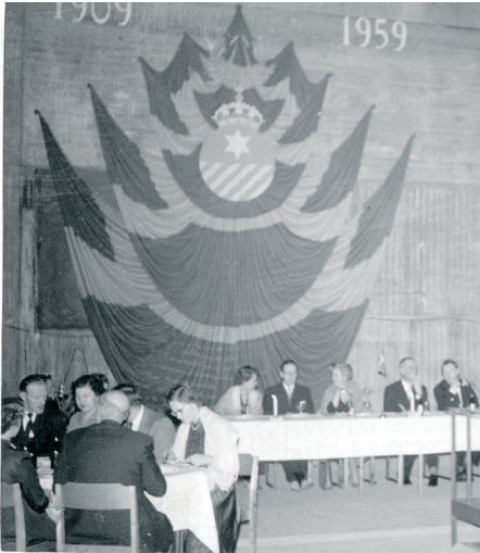
Honörsbordet med den imponerande dekorationen på väggen. Statens Vattenfallsverk firade en av många 50-årsfester. Här i Järkvissle numera rivna maskinhall.

och dricka. Kvällen bjöd på lokalteater och dansmusik till fyramannaorkester med vokallissa. Festen slutade kl. 01.00 på natten med snöyra utanför maskinstationens portar.