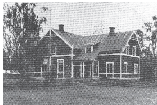
Boda skola byggd år 1907