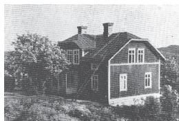
Dacke skola byggd i början av 1900-talet.