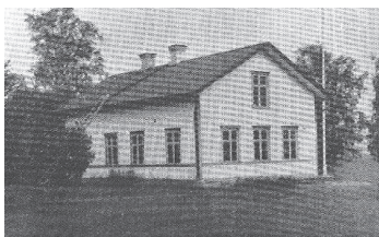
Västana skola byggd ca 1901

Undervisning för barnen i de s.k. fjällbyarna krävde särskilda insatser. En sådan var att ordna för barnens inackordering hos familjer i skolornas närhet. År 1920 anslog skolrådet för detta ändamål 100 kr per barn och år. Man försökte även ordna skolhushåll för dessa barn. Ett anordnades i Sillre 1926 för de barn som skoldagar (?) vandrade från sina hem till skolan. För detta skulle föräldern betala 75 öre per barn och dag. Det visade sig vara svårt att få in denna avgift, även från de bättre lottade, varför man upphörde med verksamheten. I fortsättningen var det eget matsäckspaket som gällde. Barn från Paljacka undervisades i Graninge eftersom vägförbindelse med Lidenbyarna saknades.