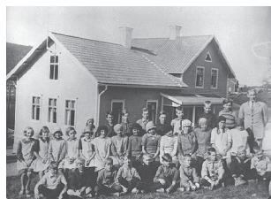
Järkvissle skola 1931