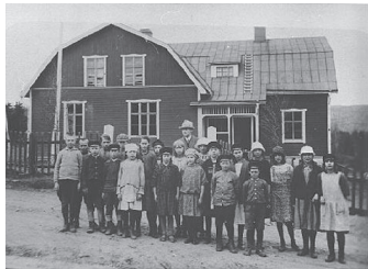
Sillre skola 1924

ersatts av kronan. Under 1900-talets början byggdes sedan skolhus i Åsen och Boda. Efter ytterligare några år byggdes skolhus även i Sillre, Dacke och Flygge. Penningkostnaderna för skolbyggnader under 1800-talet och början av 1900-talet, i Liden liksom i övriga landet, hölls nere genom att byborna bidrog med både byggnadsvirke och arbetskraft.